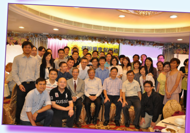
祝榮休老師生活愉快！