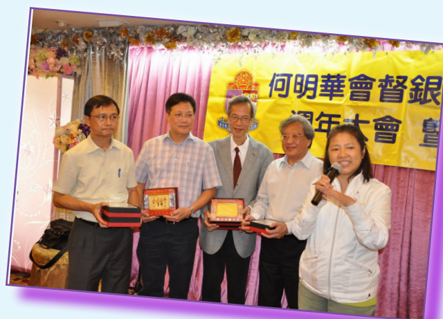
校友向榮休老師致送紀念品