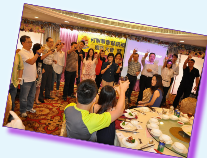
新一屆幹事向校友祝酒