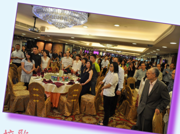
晚宴開始，齊唱校歌